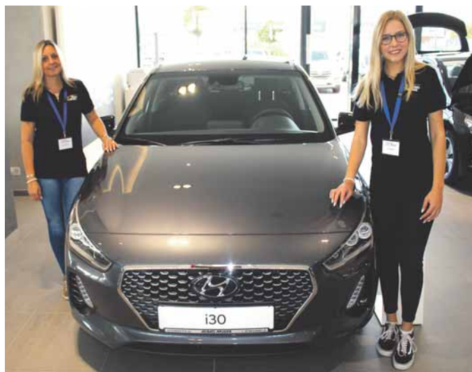
Schicker Kompaktwagen: Die dritte Generation des Hyundai i30 ist erst seit diesem Jahr auf dem Markt und bei Jung und Alt gleichermaßen gefragt