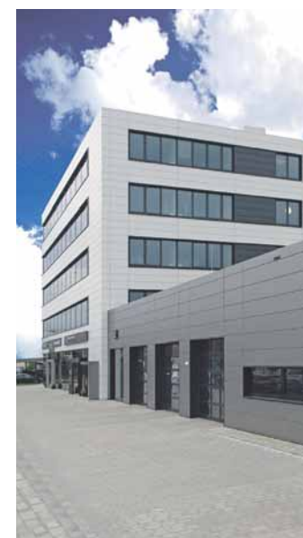
Auf dem Gelände befindet sich unter anderem auch die hauseigene Werkstatt