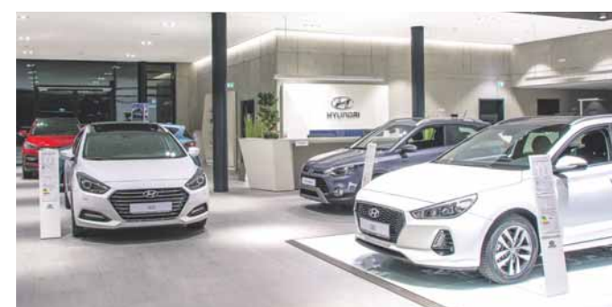
Modern, hell und edel wirken die neuen Verkaufsräume des Autohauses Allrad Müller. Insgesamt stehen 8000 qm Fläche zur Verfügung