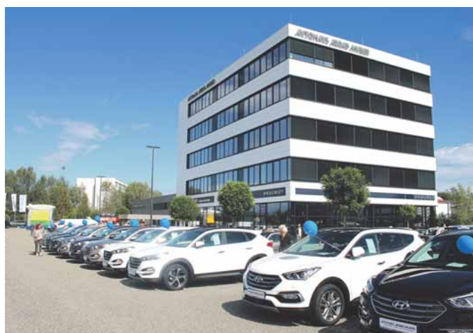
Schmuckstück: An der Ecke Rheinstraße/Allmansweilerstraße finden Kunden ab sofort die neuen Räumlichkeiten des Autohauses Allrad Müller