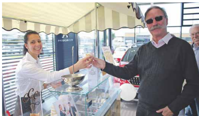
Hmmmm lecker! Für die Besucher gab's beim Familienfest gratis Eis von Gelati Conte. Das passte perfekt zum herrlichen Wetter am Eröffnungstag