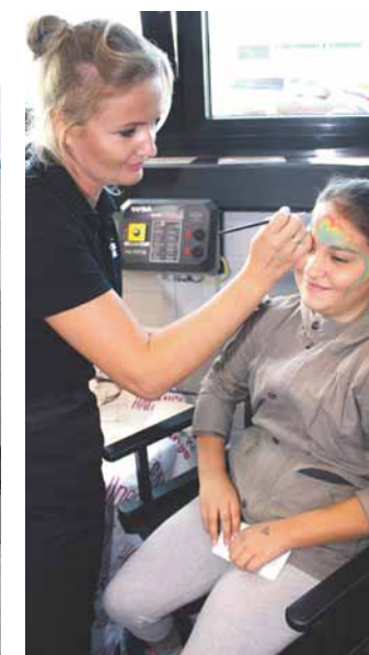
Wow: Beim Kinderschminken entstanden verschiedene tolle Kreationen